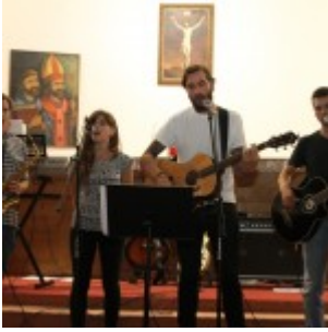
grupa Vis Major