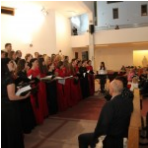
Zbor mladih Preslavnog Imena Marijina