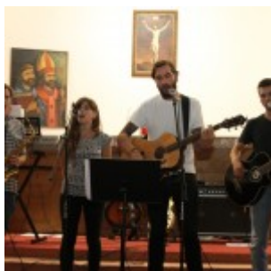
grupa Vis Major