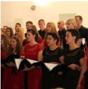
Zbor mladih Preslavnog Imena Marijina