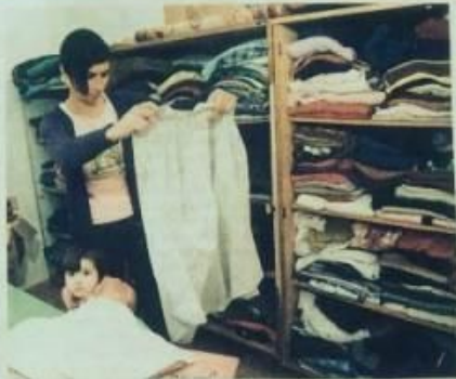
Prikupljena odjeća - siromašni je mogu uzeti koliko god žele...

DOBRA SRCA U ZAGORI U POSJETU KRŠĆANSKOJ HUMANITARNOJ UDRUZI 'PUTEVI MILOSTI' ČIJA TRI AKTIVNA VOLONTERA PREKO FACEBOOKA NUDE HRANU I ODJEĆU POTREBITIMA