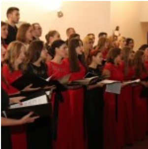
Zbor mladih Preslavnog Imena Marijina